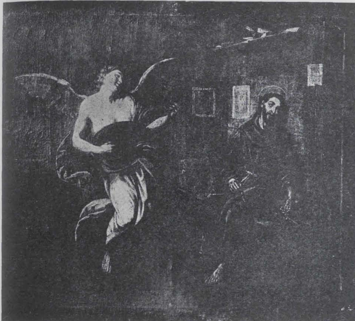
Fig. 273. — «Visió de Sant Francesc», per Antoni Viladomat, de la sèrie dels PP. Franciscans de Berga

De l'estudi del retaule de Guardiola es dedueix que en Borrassà s'aparta de les escoles fins aleshores dominants, sobretot en les escenes de moviment, en les quals sent una major frisança de vida. En les de repòs domina una solemne grandiositat, desconeguda per els trescentistes i que deriva del romànic; exemples, el sant Salvador de Guardiola i el sant Francesc de Vich. El seu dibuix és original, inclinat, per gota que pugui, cap a les expressions intencionades fins als límits de la caricatura. Sota aquest aspecte, i al mateix temps com a mostra de la seva rapidesa de concepció i execució, és notable el fragment que presentem del Calvari del retaule de Sant Pere de Terrassa (fig. 271). Un saió saltirona ridiculament al peu de la creu, mostrant sa cara grotesca i son cos arrupit, al costat mateix de la figura intensament estirada del xicot que sosté el recipient amb el fel i el vinagre i la canya capsada per l'esponja.