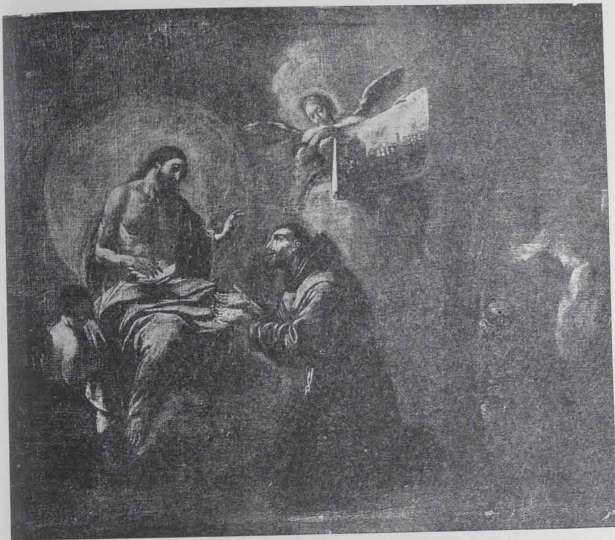
Fig. 275. — «Visió de Sant Francesc», per Antoni Viladomat, de la sèrie dels PP. Franciscans de Berga

manera d'expressar els caràcters del nostre paisatge, les ingenuïtats a la manera de Zurbarán que es troben en aquella tela emocionant de la mort de Sant Francesc que hi ha al Museu de la Ciutadella, són d'un Viladomat digne de firmar la bella tela de Florència, on el seu art aconsegueix un d'aquests moments purs.